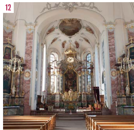
Immakulata am alten Kaplaneihaus