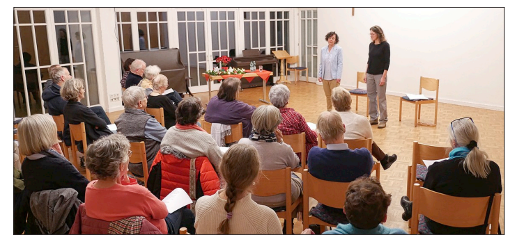
Unter dem Titel „Heute tanzen alle Sterne - Ein winterlicher Lyrikabend“ hatte das katholische Bildungswerk eingeladen.

Etwa 30 Texte hatten die beiden Künstlerinnen mitgebracht - kurze und lange Gedichte, Erzählungen, kurze Stücke, die sich nicht in die klassischen Gattungen einsortieren lassen, und Lieder. Gut zwei Dutzend Besucher hörten zu, ließen sich anrühren, zum Nachdenken anregen, zum Lachen bringen und sangen bei „Maria durch den Dornwald ging“ mit.