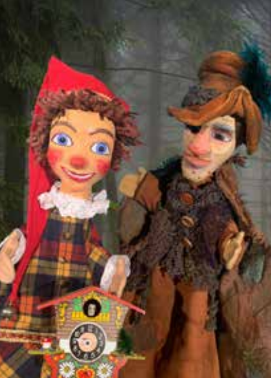
Kasper und die gestohlene Kuckucksuhr Freiburger Puppenbühne

Von seinem ersparten Taschengeld hat Kasper der Oma zum Geburtstag eine echte Kuckucksuhr gekauft! Und die muss er natürlich sofort auch den Kindern zeigen! Leider aber hat es noch jemand auf die wunderschöne Uhr abgesehen: In einem günstigen Moment stiehlt Räuber Rodewald das teure Geschenk! Was nun? Kasper und Seppel übernehmen die heikle Aufgabe, obwohl sogar ein Zauberer mit dem Räuber unter einer Decke steckt.