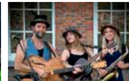
Wanda's Wagon Antwerpen/Belgien

Eine zauberhafte Show mit handgefertigten Holzmarionetten, ohne Worte. Die kurzen Geschichten spielen sich alle in der Rosengasse ab. Treffen Sie einen neugierigen Gärtner, ein flinkes Schaf, einen ausdrucksstarken Sänger und weitere Charaktere, die sich alle auf ihre Weise dieser einen Rose widmen.