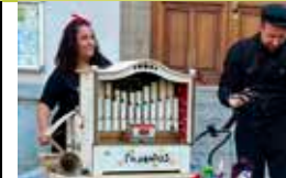
Hariak Zirkus Spanien/Frankreich

Madame Lulu ist eine sehr kontaktfreudige ältere Dame aus Paris. Nicht immer findet sie sich in der heutigen Welt zurecht. Mittels ihres unwiderstehlichen Charmes gelingt es ihr aber immer wieder, Hilfe zu bekommen.