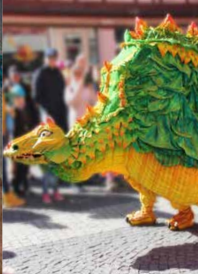
Onil, der Drache Oniversum, Freiburg

Von seinem ersparten Taschengeld hat Kasper der Oma zum Geburtstag eine echte Kuckucksuhr gekauft! Und die muss er natürlich sofort auch den Kindern zeigen! Leider aber hat es noch jemand auf die wunderschöne Uhr abgesehen: In einem günstigen Moment stiehlt Räuber Rodewald das teure Geschenk! Was nun? Kasper und Seppel übernehmen die heikle Aufgabe, obwohl sogar ein Zauberer mit dem Räuber unter einer Decke steckt.